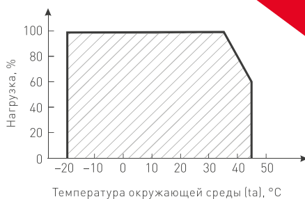
Рисунок 2. Максимальная допустимая нагрузка, % от мощности источника